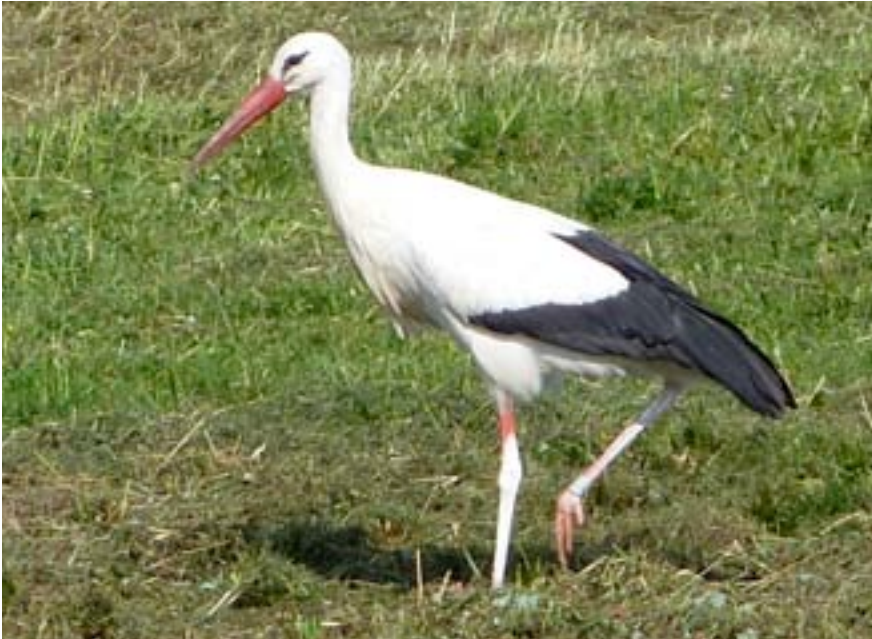
Weißstorch in Hausen v.d.H.